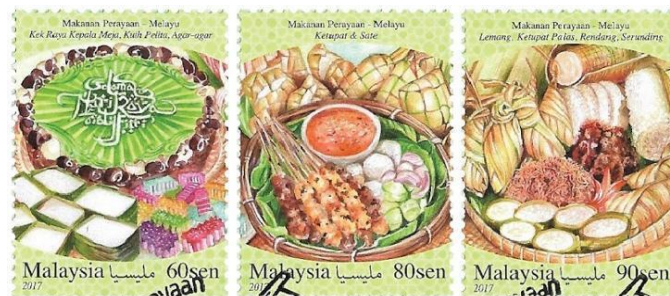
Rajah 9. Setem Aidilfitri 2017