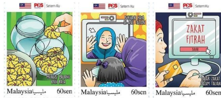
Rajah 12. Setem Aidilfitri 2021