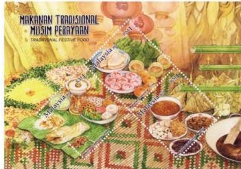
Rajah 4. Setem Aidilfitri 2010

seterusnya pada pinggan kedua merupakan ilustrasi kuih muih masyarakat Melayu yang terdiri dari agar-agar, kerepek pisang, kuih bahulu, kuih bangkit, kuih ros serta rempeyek. Kuih muih ini merupakan kuih tradisi yang menjadi kudapan para tetamu dan sedara mara ketika mereka mengunjungi rumah sesama mereka.