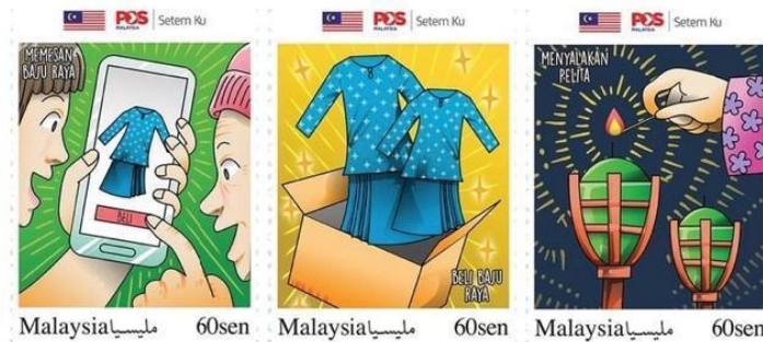
Rajah 13. Setem Aidilfitri 2021