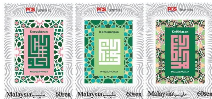
Rajah 11. Setem Aidilfitri 2020