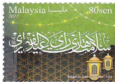
Rajah 6. Setem Aidilfitri 2017