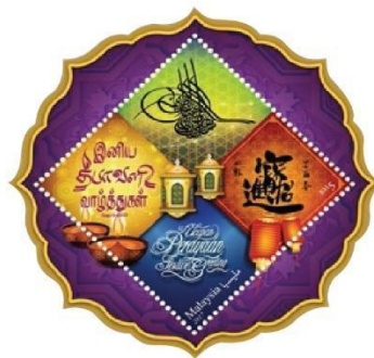
Rajah 7. Setem Aidilfitri 2017