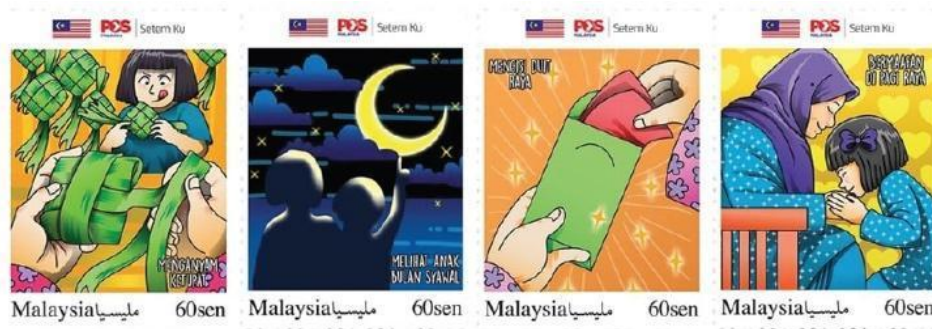
Rajah 14. Setem Aidilfitri 2021