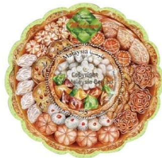
Rajah 8. Setem Aidilfitri 2017

Setem Aidilfitri ini merupakan keluaran setem keluaran ada tahun 2017. Setem ini menggunakan kaligrafi tulisan Selamat Hari Raya Aidilfitri. Kaligrafi merupakan tulisan indah yang tulisannya dibentuk melalui kaedah tertentu berasaskan sumbernya iaitu al-Quran dan al-Hadith yang menarapkan ciri dan nilai kerohanian yang diterjemahkan melalui huruf yang dibentuk (Makmur & Muhammad, 2015). Penggunaan kaligrafi sebagai tulisan bertujuan mengangkat falsafah dan simbol kesenian yang ada dalam peradaban masyarakat Melayu (Makmur & Muhammad, 2015). Perkataan 'Calligraphy berasal dari dua suku kata Yunani iaitu Kallios: beauty , indah dan Graphein: to write , menulis. Menurut Kamus Dewan, edisi keempat. 1989 ertinya ialah "seni menulis yang indah, tulisan tangan yang menghasilkan huruf atau tulisan yang indah sebagai suatu seni khat. Maka keluaran setem pada tahun ini mengangkat budaya masyarakat Melayu melalui kebijaksanaan orang Melayu dalam kemahiran penulisan yang tulisan Jawi dengan gaya yang indah dan unik. Ia dapat dilihat dengan jelas keunikan kaligrafi yang digunakan dalam setem keluaran tahun 2017. Ia juga dihiasi dengan lampu pelita berwarna kuning. Rajah 7 merupakan setem Aidilfitri yang menggunakan tulisan khat berwarna hitam dan mempunyai latar belakang tona hijau dan kuning.