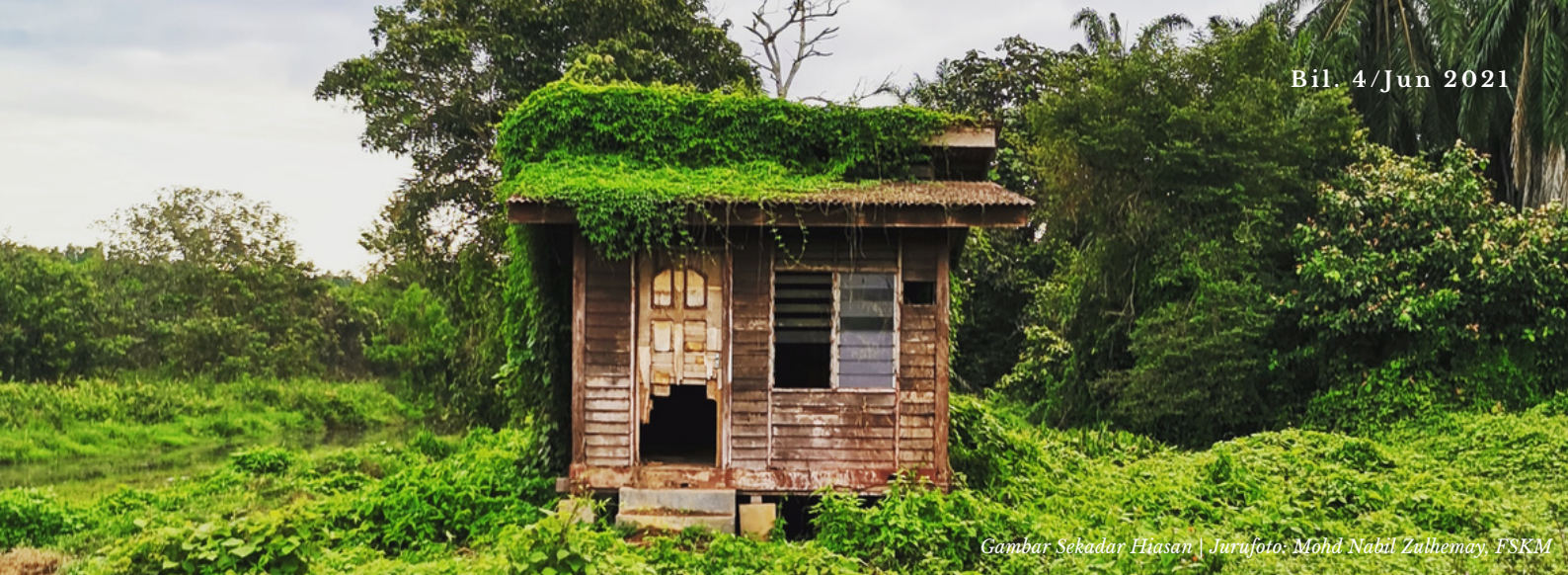
Gambar Sekadar Hiasan | Jurufoto: Mohd Nabil Zulhemay, FSKM